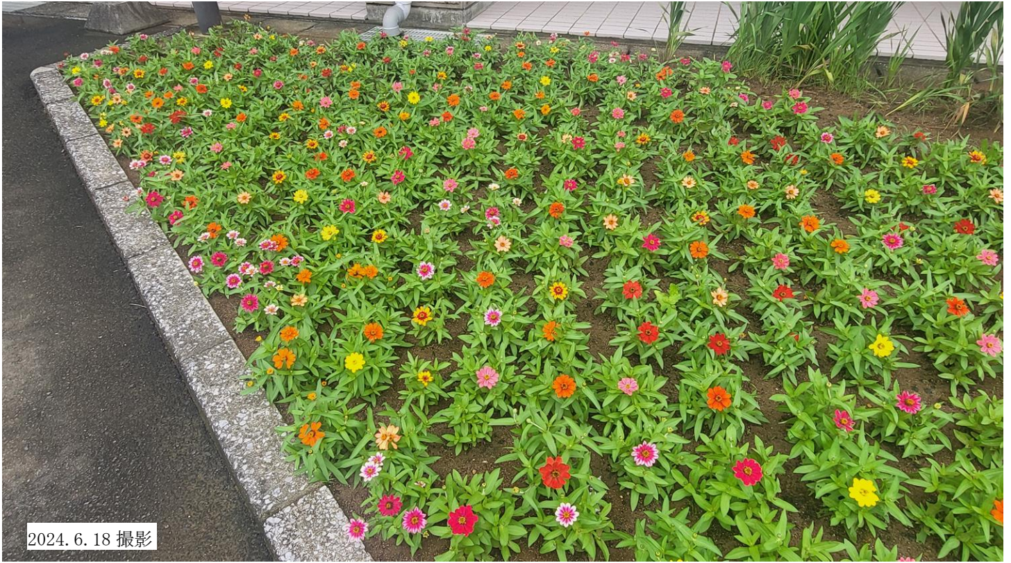
2024. 6. 18 撮影