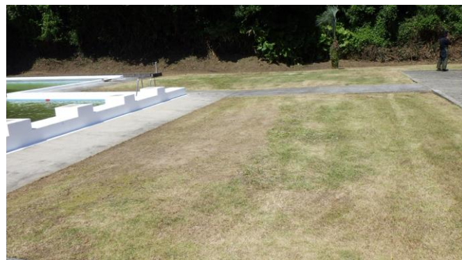
市営プール内外の草払い・剪定作業を実施。5月