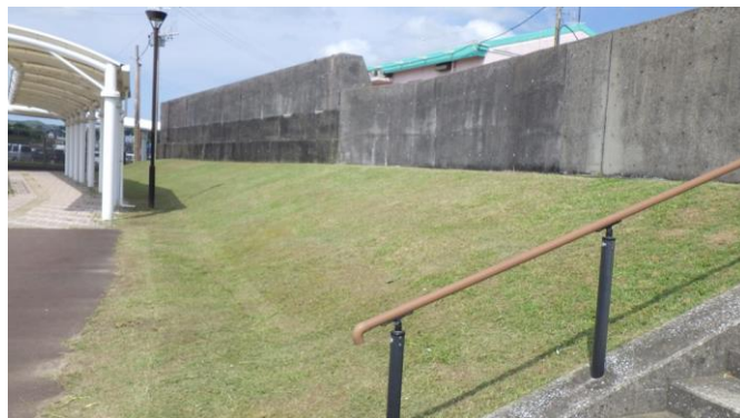
日ボ公園周辺の草払い 6月

一般社団法人西之表市まちづくり公社のホームページでは、市民会館の予約状況やブログを掲載しております。