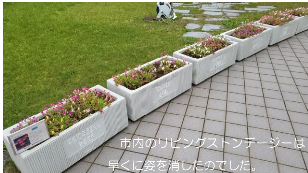
市内のリビングストーンデージーは早くに姿を消したのでした。

追肥を与えても病気予防をしても復活しません。例年に比べ、花も小さかったと思います。